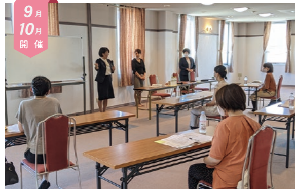
9月10月開催 すぐに!いつか!?働きたい女性 Fullサポートセミナー

働きたいと思っている女性と、採用担当者が『ざっくばらん』に語り合う会です。「短時間で働きたいけど大丈夫?」「土日休みしたいけど面接で言っているの?」など、採用のステップに至る一歩手前に、本音で語り合える座談会です。