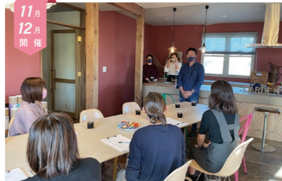
11月12月開催 すぐに!いつか!?働きたい女性 会社見学&座談会

お仕事を休んでいる期間のスキル・経験の掘り起こし、自己分析を通じて、就職活動への動機づけをします。また、就職活動の疑問や子育ての悩みについて、講師や参加者のみなさんとざっくばらんに話せる時間もあります。