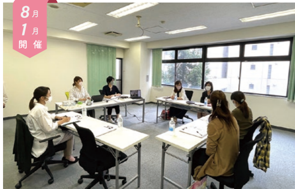
8月1月開催 女性と企業担当者による マッチング座談会

働きたいと思っている女性と、採用担当者が『ざっくばらん』に語り合う会です。「短時間で働きたいけど大丈夫?」「土日休みしたいけど面接で言っているの?」など、採用のステップに至る一歩手前に、本音で語り合える座談会です。