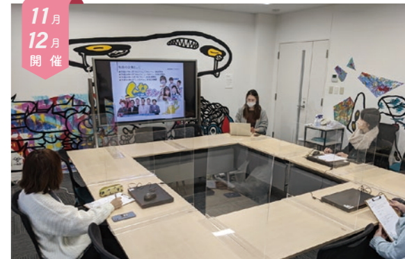
11月12月開催 女性のためのおしごと体験会

子育てや家事と仕事を両立した経験のある講師による、レッスン座談会です。就職活動や普段の生活に役立つテクニックのレッスンと、ロールモデルである講師の両立方法の紹介や参加者のみなさんとの意見交換をします。