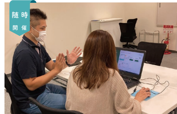
ワンショット講座・お悩み相談室

ブランクやスキルの不安など、就職に関する様々な悩みを、専任の講師やキャリアコンサルタントと一緒に考えます。