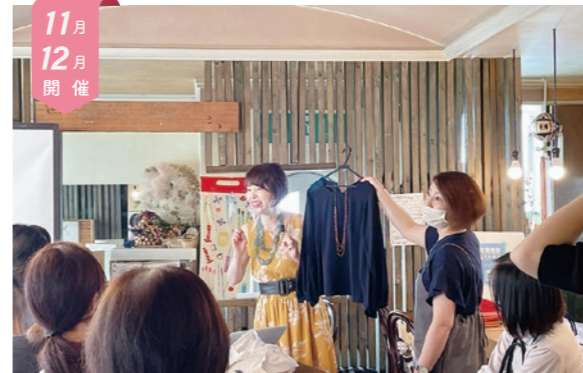
11月12月開催 すぐに!いつか!?働きたい女性 レッスン&座談会

女性が活躍している企業の見学会です。実際に働いている女性と交流し、職場環境や仕事の内容、両立の工夫や楽しみ、大変なことなど、求人票だけではわからない貴重なお話を伺います。