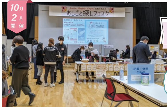
10月2月開催 女性のためのおしごと探しフェスタ (合同就職説明会)

仕事と家庭を両立している女性が多く働いている企業でのおしごと体験会です。経験の無い業界への挑戦や、ブランクがあるなどのさまざまな不安を、働く体験を通じて自信につなげ、再就職に踏み出す一歩を応援します。