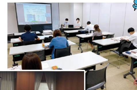
昨年のセミナー・ミニセミナーの様子

個人ワークを交えながら、女性活躍によるメリットや好事例、その風土づくりなどを紹介するほか、女性が働きやすい職場環境づくりに活用できる助成金などについてもご案内します。