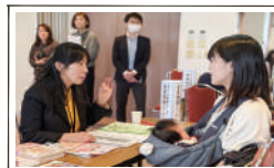
保育情報コーナー など(予定)