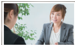
ハローワーク相談コーナー